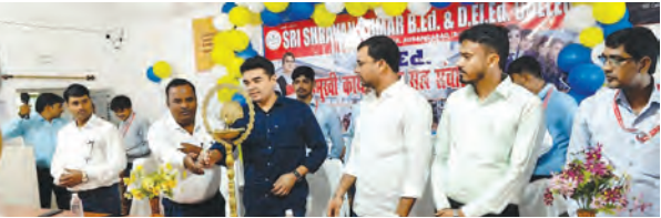
निज संवाददाता | हसपुरा(औरंगाबाद)

हसपुरा प्रखंड के फतेगंज गांव स्थित श्री श्रवण कुमार बीएड कॉलेज में बुधवार को नए सत्र की शुरुआत को लेकर उन्मुखीकरण समारोह का आयोजन किया गया। अध्यक्ष विकास