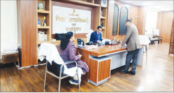
निज संवाददाता | गोड्डा

गोड्डा जिले के उपायुक्त की अध्यक्षता में एक महत्वपूर्ण स्वास्थ्य विभाग की समीक्षा बैठक आयोजित की गई। इस बैठक का मुख्य उद्देश्य आयुष्मान भारत योजना के तहत जिले के अस्पतालों में उपलब्ध सुविधाओं, भुगतान प्रक्रिया और अन्य समस्याओं पर विचार विमर्श करना था। बैठक में उपायुक्त ने आयुष्मान भारत योजना से संबंधित विभिन्न पहलुओं पर विस्तारपूर्वक चर्चा की, ताकि योजना के अंतर्गत उपचार की गुणवत्ता और सेवाओं में सुधार किया जा सके। बैठक के दौरान उपायुक्त ने विशेष रूप से निजी अस्पतालों के संचालकों से आयुष्मान योजना के तहत इलाज