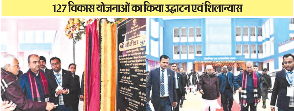
127 विकास योजनाओं का किया उद्घाटन एवं शिलान्यास

सिवान, एजेंसी। मुख्यमंत्री नीतीश कुमार ने आज प्रगति यात्रा के क्रम में सिवान जिला को लगभग 109 करोड़ रुपये की योजनाओं की सौगात दी। मुख्यमंत्री ने रिमोट के माध्यम से 127 विकासात्मक योजनाओं का उद्घाटन एवं शिलान्यास किया। इनमें 83 करोड़ 47 लाख 37 हजार रुपये की लागत से 122 योजनाओं का उद्घाटन तथा 25 करोड़ 38 लाख 27 हजार रुपये की लागत से 5 योजनाओं का शिलान्यास शामिल है। मुख्यमंत्री ने प्रगति यात्रा के क्रम में पचरुखी प्रखंड के ग्राम नारायणपुर में प्रस्तावित सीवान-बाईपास का स्थल निरीक्षण किया। अधिकारियों ने मैप के माध्यम से प्रस्तावित सीवान-बाईपास के संबंध में मुख्यमंत्री को विस्तृत जानकारी दी। प्रस्तावित पथ मोहम्मदपुर मोड़ (एन0एच0-531) से छपिया-टेढ़िघाट-गोपालपुर (एन0एच0-227ए) में आर0रो0बो0 सहित चौड़ीकरण एवं मजबूतीकरण का कार्य किया जाना है। इस प्रस्तावित पथ की कुल लंबाई 13.80 किलोमीटर है।