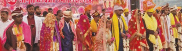
निज संवाददाता | अंबा(औरंगाबाद)