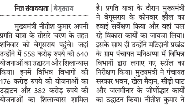
निज संवाददाता | बेगूसराय

मुख्यमंत्री नीतीश कुमार अपनी प्रगति यात्रा के तीसरे चरण के तहत शनिवार को बेगूसराय पहुंचे। जहां उन्होंने में 558 करोड़ रुपये की 640 योजनाओं का उद्घाटन और शिलान्यास किया। इनमें विभिन्न विभागों की 176 करोड़ रुपये की योजनाओं का उद्घाटन और 382 करोड़ रुपये की योजनाओं का शिलान्यास शामिल