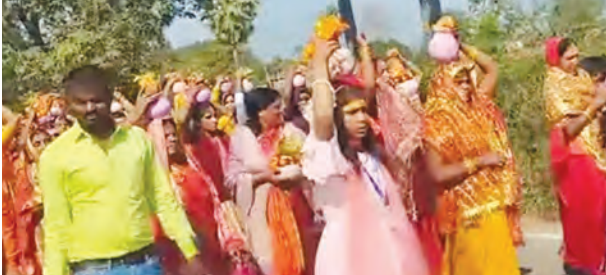
निज संवाददाता | रफीगंज (औरंगाबाद)

जाती है। यह अवैध खेती नक्सलियों के लिए आय का एक बड़ा जरिया है। अफीम और गांजे की खेती से मिलने वाले धन का उपयोग नक्सल गतिविधियों को बढ़ावा देने में किया जाता है। सुरक्षा बलों ने इस कार्रवाई से यह संदेश दिया है कि अवैध खेती और नशे के कारोबार को किसी भी हाल में बर्दाश्त नहीं किया जाएगा। पुलिस ने ग्रामीणों से अपील की है कि वे किसी भी संदिग्ध गतिविधि की सूचना तुरंत दें, ताकि इस तरह की अवैध गतिविधियों पर रोक लगाई जा सके। यह कार्रवाई न केवल अफीम के अवैध व्यापार पर अंकुश लगाने के लिए महत्वपूर्ण है, बल्कि नक्सल फंडिंग के खिलाफ भी एक बड़ा कदम है। पुलिस का यह अभियान क्षेत्र में कानून व्यवस्था को मजबूत करने और अवैध गतिविधियों को समाप्त करने की दिशा में एक महत्वपूर्ण प्रयास है।