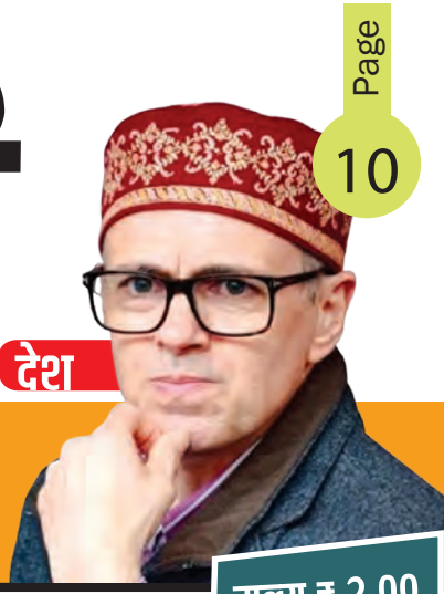
मूल्य ₹ 2.00

• औरंगाबाद • बुधवार • 05 फरवरी 2025 • वर्ष 27 • अंक 57 • पृष्ठ 12