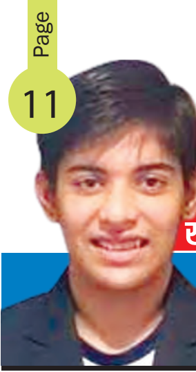
थुवल पक्ष, मगरणी, विक्रम संवत् 2081