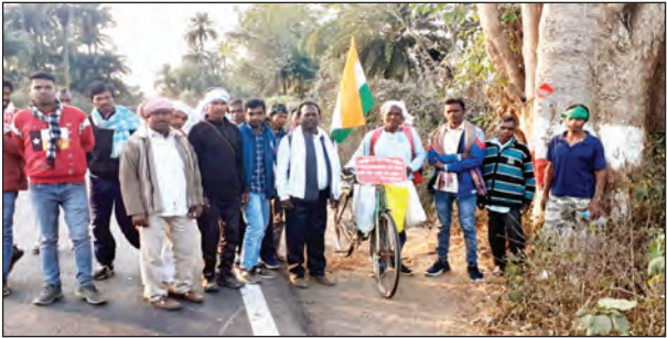
निज संवाददाता | गोड्डा

सतर्क है। विभाग की ओर से समय-समय पर ऐसे निरीक्षण होते रहेंगे ताकि कोई भी नियमों का उल्लंघन न कर सके। उन्होंने अल्ट्रासाउंड केंद्र संचालकों को निर्देश दिया कि वे सभी सरकारी दिशानिर्देशों का सख्ती से पालन करें और किसी भी प्रकार की अनियमितता से बचें। स्वास्थ्य विभाग के अधिकारियों ने भी इस निरीक्षण के दौरान कई महत्वपूर्ण बिंदुओं पर चर्चा की और यह सुनिश्चित किया कि केंद्रों पर सभी आवश्यक सुविधाएं और संसाधन मौजूद हों। इस निरीक्षण का मुख्य उद्देश्य बालिका भ्रूण हत्या को रोकना और 'बेटी बचाओ, बेटी पढ़ाओ' अभियान को सफल बनाना है, ताकि समाज में बेटीओं को समान अधिकार और सम्मान मिल सके।