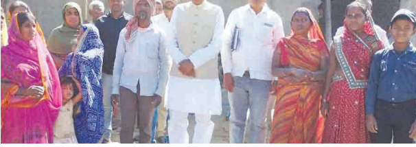
एसवीपी संवाददाता | औरंगाबाद

पंचायत में ग्राम संपर्क यात्रा की। इस दौरान उन्होंने खैरा, कड़मरी, मुंशी बीघा, फतेहपुर, दयालपुर, मधुपुर, बर्डी खुर्द, बर्डी कला, देवढ़ी, पिठनुआ, रामपुर, तेंदुआ बिदालिया एवं सिंदुरिया गांव का दौरा कर ग्रामीणों की समस्याएं सुनीं और उनके समाधान का आश्वासन दिया।