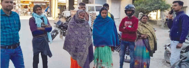
निज संवाददाता | रफींगंज (औरंगाबाद)