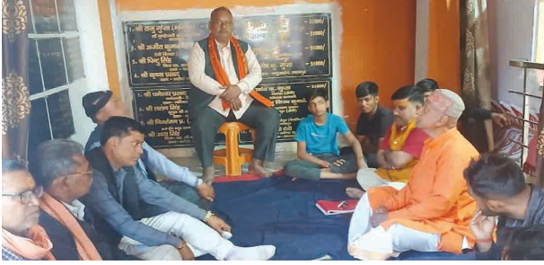
निज संवाददाता | मदनपुर(औरंगाबाद)

पुलिस अधिकारियों ने बताया कि इस तरह की अवैध खेती को पूरी तरह खत्म करने के लिए आगे भी लगातार छापेमारी अभियान जारी रहेगा। स्थानीय प्रशासन ने ग्रामीणों से भी अपील की है कि वे अवैध अफीम खेती की जानकारी तुरंत पुलिस को दें, ताकि माफियाओं पर नकेल कसी जा सके। इस पूरे अभियान के बाद इलाके में हड़कंप मचा हुआ है, और पुलिस लगातार अपनी जांच में जुटी हुई है।