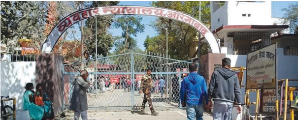
एसवीपी संवाददाता | औरंगाबाद

इस दर्दनाक घटना के बाद परिजनों का रो-रोकर बुरा हाल है, वहीं स्थानीय लोग प्रशासन से तेज रफ्तार वाहनों पर सख्ती की मांग कर रहे हैं। क्षेत्र में लगातार हो रहे सड़क हादसों से लोग चिंतित हैं और यातायात नियमों के कड़ाई से पालन