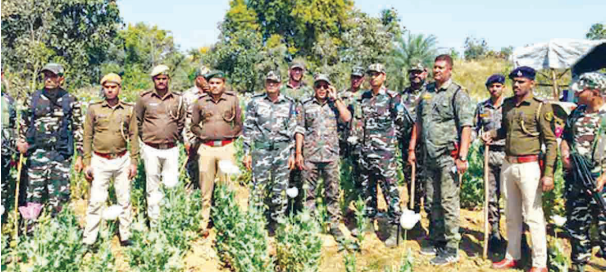
निज संवाददाता | मदनपुर (औरंगाबाद)

जिले के डिबरा थाना क्षेत्र के बनुआ पंचायत के जंगली इलाकों में पुलिस और वन विभाग की संयुक्त कार्रवाई में करीब 6 एकड़ में फैले अफीम की अवैध खेती को नष्ट कर दिया गया। इस बड़ी कार्रवाई में पुलिस के साथ 29वीं बटालियन सशस्त्र सीमा बल और वन विभाग की टीम शामिल रही।