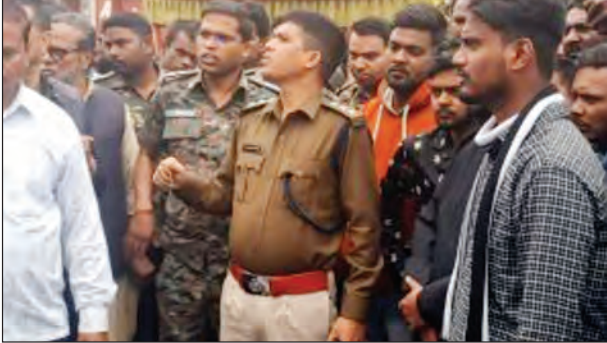
निज संवाददाता | गिरिडीह

परिजनों ने अस्पताल में किया हंगामा, पुलिस ने किया लाठीचार्ज