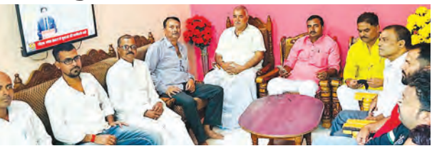
औरंगाबाद