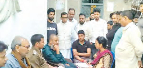
डॉक्टर फरार, अस्पताल पर जड़ा मिला ताता

परिजनों ने डॉक्टर की बात मान ली, लेकिन ऑपरेशन के दौरान डॉक्टर ने लापरवाही बरती और महिला की नस कट गई, जिससे अत्यधिक रक्तस्राव होने लगा। महिला की तबीयत बिगड़ती देख डॉक्टर चबरा