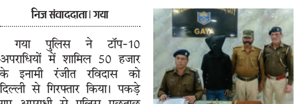
निज संवाददाता। गया

कि सड़क पर मवेशी को बचाने के चक्कर में गाड़ी अनियंत्रित हो गई और सड़क किनारे पलट गई। इस हादसे में दो लोग गंभीर रूप से जख्मी हो गए। इलाज के क्रम में एक व्यक्ति की मौत हो गई जबकि एक इलाजरत है। शव को कब्जे में लेकर पोस्टमार्टम हेतु बिहार शरीफ सदर अस्पताल भेज दिया गया है और पुलिस पूरे मामले को छानबीन में जुट गई है।