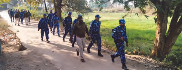
निज संवाददाता | हसपुरा (औरंगाबाद)

थी। थानाध्यक्ष शंभू कुमार ने बताया कि एफएसएल (फॉरेंसिक साइंस लैब) की टीम को जांच के लिए बुलाया गया है। पुलिस ने घटनास्थल से एक कीपैड मोबाइल भी बरामद किया है, जिसकी जांच की जा रही है। पुलिस मोबाइल के कॉल डिटेल्स और मैसेज की भी पड़ताल कर रही है, ताकि यह पता लगाया जा सके कि किशोरी के किसी से कोई बातचीत हुई थी या किसी ने उसे उकसाया था। पुलिस की अपील और जांच जारी है। पुलिस ने स्थानीय लोगों और परिजनों से सहयोग करने की अपील की है ताकि मामले की गहराई से जांच की जा सके। पुलिस का कहना है कि पोस्टमार्टम रिपोर्ट आने के बाद ही मौत के असली कारणों का खुलासा होगा। फिलहाल, हर पहलू से जांच की जा रही है और जल्द ही पूरे मामले का खुलासा किया जाएगा।