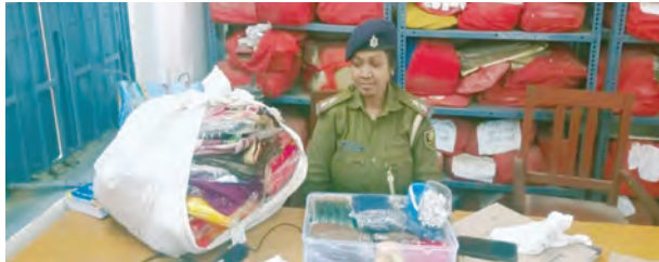
निज संवाददाता | हसपुरा (औरंगाबाद)

प्रेस कॉन्फ्रेंस में उप विकास आयुक्त ने बताया कि देव रिंग रोड कई प्रमुख मार्गों से जुड़ेगा, जिससे एनएच-2, एनएच-139, अम्बा, बालूगंज, मदनपुर और औरंगाबाद से देव का सफर सुगम हो जाएगा। इसके निर्माण से हर साल कार्तिक