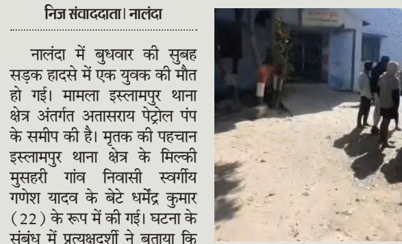
निज संवाददाता। नालंदा