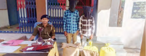
निज संवाददाता | ओबरा (औरंगाबाद)

ओबरा थाना क्षेत्र में हुई चोरी की घटना का पुलिस ने खुलासा कर दिया है। एक पैक्स गोदाम और एक सरकारी स्कूल में चोरी के मामले में पुलिस ने दो युवकों को गिरफ्तार किया है, जबकि एक विधि विरुद्ध किशोर को निरुद्ध किया गया है। चोरी की यह घटना साल फरवरी की रात घटी थी, जब अज्ञात चोरों ने पैक्स गोदाम से गेहूं और सरकारी स्कूल से पंखे चोरी कर लिए थे। घटना के बाद गोदाम संचालक और स्कूल प्रशासन ने स्थानीय थाना में अज्ञात लोगों के खिलाफ मामला दर्ज करवाया था। मामले की गंभीरता को देखते