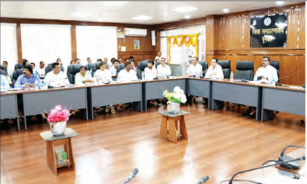
निज संवाददाता | दुमका

दुमका समाहरणालय सभाघार में सोमवार को उपायुक्त अंजनेयुलु दोड़े की अध्यक्षता में जिला समन्वय समिति की महत्वपूर्ण बैठक आयोजित की गई। बैठक में जिले में चल रही विभिन्न योजनाओं की प्रगति की समीक्षा की गई और उपायुक्त ने संबंधित विभागों के अधिकारियों को निर्देश दिया कि सभी योजनाओं का क्रियान्वयन समयबद्ध तरीके से सुनिश्चित किया जाए, ताकि लाभकों को जल्द से जल्द लाभ मिल सके। उन्होंने खासतौर पर इस बात पर जोर दिया कि जनकल्याणकारी योजनाओं का व्यापक प्रचार-प्रसार किया जाए, ताकि कोई भी योग्य व्यक्ति इन सुविधाओं से वंचित न रहे। बैठक के दौरान उपायुक्त ने सभी प्रखंड विकास पदाधिकारियों को निर्देश दिया कि वे अपने-अपने क्षेत्रों में प्रखंड स्तरीय समन्वय समिति की नियमित बैठकें आयोजित करें और योजनाओं के कार्यान्वयन की नियमित निगरानी करें। उन्होंने अधिकारियों से कहा कि वे योजनाओं का स्थल निरीक्षण करें और क्षेत्रीय अधिकारियों की जवाबदेही तय करें, जिससे विकास कार्यों में किसी प्रकार की लापरवाही न हो। बैठक में