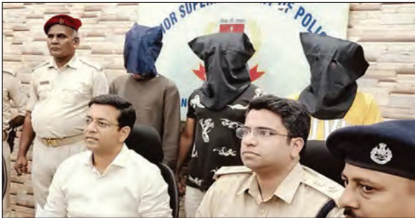
निज संवाददाता | जमशेदपुर (पूर्वी सिंहभूम)