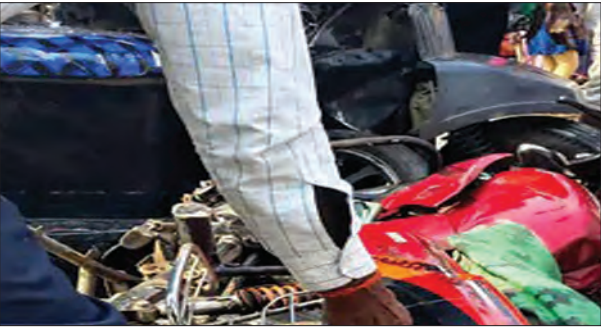
निज संवाददाता | साहिबगंज

साहिबगंज जिले के बोरियो थाना क्षेत्र में एक भीषण सड़क दुर्घटना में बाइक और ऑटो की आमने-सामने टक्कर हो गई, जिसमें बाइक सवार एक युवक की दर्दनाक मौत हो गई, जबकि ऑटो में सवार महिला और बच्ची समेत छह लोग गंभीर रूप से घायल हो गए। यह हादसा बोरियो-बरहेट मुख्य सड़क पर तेलो गांव के पास हुआ। बताया जा रहा है कि बाइक सवार तीन युवक बिना हेलमेट के थे और मेला देखकर अपने घर लौट रहे थे, तभी विपरीत दिशा से आ रही एक ऑटो से जबरदस्त टक्कर हो गई।