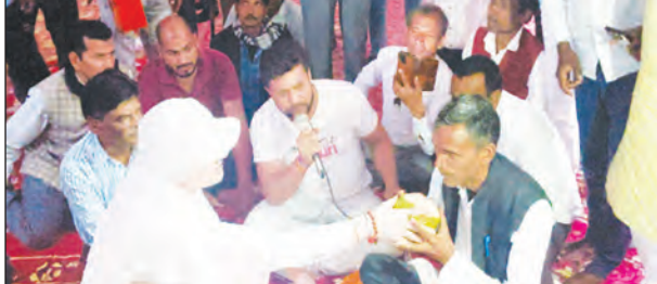
निज संवाददाता | हरिहरगंज

कि स्वास्थ्य सेवाओं को बेहतर करने की दिशा में प्रशासन गंभीरता से प्रयास कर रहा है और जल्द ही सीएचसी को पूरी तरह कार्यरत किया जाएगा। सिविल सर्जन और अनशनकारियों के बीच सकारात्मक बातचीत के बाद यह आंदोलन तत्काल समाप्त हो गया। वार्ता के दौरान सिविल सर्जन ने अनशनकारियों की सभी मांगों को ध्यानपूर्वक सुना और उन्हें समाधान का भरोसा दिया। इसके बाद सिविल सर्जन ने पुरानी सीएचसी का निरीक्षण भी किया और वहां की वर्तमान स्थिति का जायजा लिया। निरीक्षण के दौरान उन्होंने अस्पताल