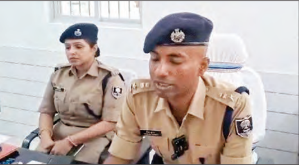
निज संवाददाता | सासाराम (रोहतास)