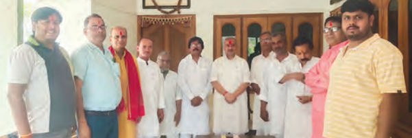
एसवीवी संवाददाता | औरंगाबाद