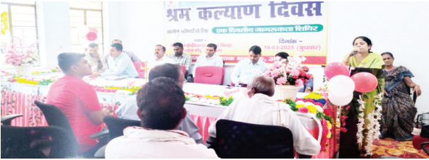
एसवीवी संवाददाता | औरंगाबाद

श्रम संसाधन विभाग द्वारा बुधवार को राजकीय महिला आर्टीआई, रंभान बिगहा, करहारा मोड़, औरंगाबाद के सभागार में श्रम कल्याण दिवस सह एक दिवसीय जागरूकता शिविर का आयोजन किया गया। इस शिविर में जिले के प्रत्येक पंचायत से एक-एक श्रमिक को आमंत्रित किया गया, जहां उन्हें श्रम विभाग द्वारा संचालित विभिन्न योजनाओं की जानकारी दी गई। शिविर के दौरान बिहार शताब्दी अंसंगठित कार्यक्षेत्र कामगार एवं शिल्पकार सामाजिक सुरक्षा योजना के तहत तीन मूलक श्रमिकों के आश्रितों को 30,000 रुपये की डमी चेक प्रदान की गई। इसके अलावा, बिहार प्रवासी मजदूर दुर्घटना अनुदान योजना के तहत मृत प्रवासी श्रमिकों के आश्रितों को लाभ देने की जानकारी