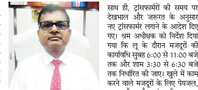
एसवीवी संवाददाता | औरंगाबाद