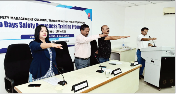
निज संवाददाता | बोकारो

बीएसएल के ज्ञानार्जन एवं विकास विभाग में संयंत्र के अधिकारियों के लिए दो दिवसीय सुरक्षा जागरूकता प्रशिक्षण कार्यक्रम का आयोजन 27 एवं 28 मार्च को किया जा रहा है। इस कार्यक्रम में लगभग चालीस अधिकारी विभिन्न विभागों से शामिल हो रहे हैं तथा फैक्टरी के रूप में वैसे अधिकारी योगदान कर रहे हैं जिन्होंने दिनांक तथा कार्यस्थल पर सुरक्षा के विषय में अपने विचार रखे। उन्होंने प्रतिभागियों को सुरक्षा शपथ दिलाई तथा कार्यस्थल पर सुरक्षा के दूस्रे सहकर्मियों से साक्षात् करके अपील की। टोपों ने भी प्रतिभागियों से इस कार्यक्रम से लाभ उठाने की अपील की। कार्यक्रम के आयोजन में वरीय ओपरेटिव (एच आर