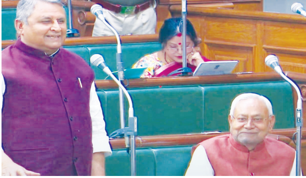
निज संवाददाता | पटना

नीतीश सरकार ने नए जिले या प्रमंडल, अनुमंडल बनाने की संभावनाओं को खारिज कर दिया है। चुनावी साल में बिहार में कोई नया चुनाव से पहले बिहार में नया जिला या अनुमंडल, प्रखंड बनाए जा सकते हैं। हालांकि, अब सरकार ने स्पष्ट कर दिया है कि ऐसे कोई प्रस्ताव विचाराधीन नहीं हैं।