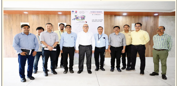
निज संवाददाता | बोकारो

बीएसएल में जारी स्वच्छता पखवाड़ा के तहत 27 मार्च को स्वच्छता के प्रति जन-जागरूकता हेतु हस्ताक्षर अभियान कार्यक्रम का आयोजन किया गया। इसके तहत बीएसएल के इस्तरा भवन, अधिशासी निदेशक (संकारी) कार्यालय तथा सिटी सेंटर स्थित मैत्री भवन में लोगों ने हस्ताक्षर अभियान में भाग लिया। हस्ताक्षर अभियान में