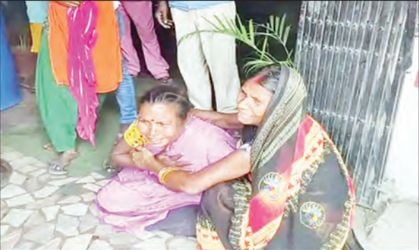
निज संवाददाता | धनबाद