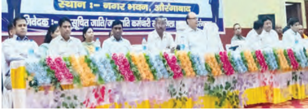
निज संवाददाता | औरंगाबाद