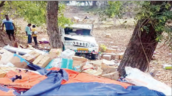
निज संवाददाता | पाकुड़

सोमवार को लिट्टीपाड़ा थाना क्षेत्र के सिमलौंग-धरमपुर मुख्य सड़क मार्ग पर बड़ा सड़क हादसा हो गया। एक दवाइयों से लदी पिकअप वैन अनियंत्रित होकर पेड़ से टकरा गई और कई बार पलट गई। इस भीषण हादसे में वाहन चालक की मौके पर ही मौत हो गई जबकि दो अन्य गंभीर रूप से घायल हो गए। यह हादसा तब हुआ जब पिकअप वैन देवघर से दवाइयों लेकर बरहरवा की ओर जा रही थी। बताया जा रहा है कि यह दुर्घटना बड़ा मुड़जोड़ा गांव के पास स्थित एक तिखे घुमावदार मोड़ पर हुई, जहां वाहन का संतुलन अचानक बिगड़ गया। पिकअप वैन एक के बाद एक तीन बार पलटी और फिर सड़क किनारे खड़े एक विशाल पेड़ से जा टकराई। इस टक्कर की आवाज इतनी तेज थी कि आसपास के ग्रामीण घटनास्थल की ओर दौड़ पड़े। लोगों ने देखा कि वाहन बुरी तरह से क्षतिग्रस्त हो चुका है और दवाइयां