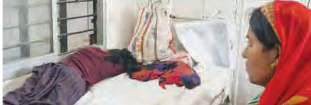
निज संवाददाता | मदनपुर (औरंगाबाद)

किसानों ने यह भी आरोप लगाया कि सड़क किनारे की उनकी उपजाऊ भूमि को ‘धनहर’ या ‘फिट’ की श्रेणी में डाल कर कम मुआवजा दिया जा रहा है। इससे किसानों में भारी असंतोष है और कई जगहों पर