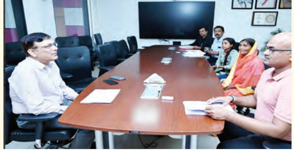
निज संवाददाता | हाजीपुर (वैशाली)