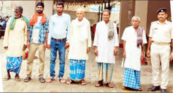
निज संवाददाता | रजौली (नवादा)