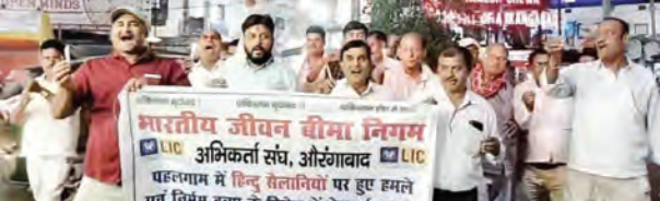
एसवीवी संवाददाता | औरंगाबाद

इस मौके पर उपविचार आयुक्त, जिला कल्याण पदाधिकारी, भूमि सुधार उप समाहर्ता, समाज कल्याण पदाधिकारी समेत कई विभागों के अधिकारी उपस्थित थे। जनता दरबार में कुल 138 आवेदन आए, जिनमें से अधिकांश पर मौके पर ही कार्रवाई शुरू कर दी गई।