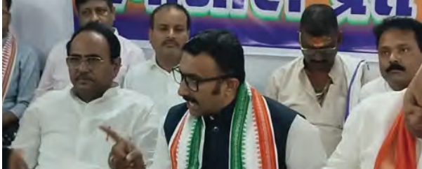
निज संवाददाता। बक्सर

प्रधानमंत्री नरेंद्र मोदी के जातीय जनगणना को मंजूरी देने के बाद राजनीतिक गलियारों में श्रेय लेने की होड़ मच गई है। शुक्रवार को बक्सर में एनडीए नेताओं ने प्रेस वार्ता कर इस फैसले को “ऐतिहासिक और राजद झूठा श्रेय लेने में जुटे हैं, जबकि बिहार सरकार ने 2020 में केंद्र की सहमति से जातीय सर्वेक्षण कराया था, जिसे मुख्यमंत्री नीतीश कुमार ने लागू किया। उस समय तेजस्वी सरकार में नहीं थे, अब वो भी श्रेय लेना चाहते हैं।” प्रेस वार्ता में भाजपा, जदयू, लोजपा (रामकिलास) समेत एनडीए के सभी घटक दलों के जिला अध्यक्ष उपस्थित रहे।