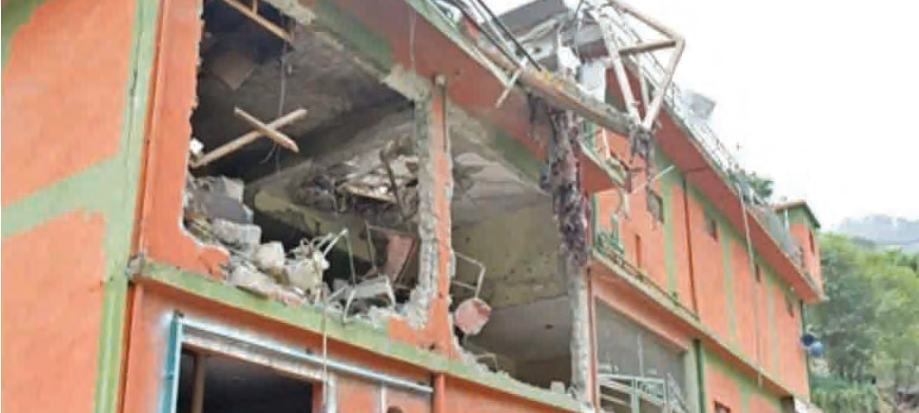
एजेंसी | नई दिल्ली

जम्मू-कश्मीर के पहलगाम में 22 अप्रैल को आतंकियों ने धर्म पुष्कर 26 पर्यटकों की गोली मारकर हत्या कर दी थी। आतंकियों ने सिर्फ पुरुषों की हत्या की। इस आतंकी हमले में कई महिलाओं ने अपने पतियों को खो दिया। इस हमले का जवाब देने के लिए भारत ने ‘ऑपरेशन सिंदूर’ चलाया। ये उन महिलाओं का प्रतीक है, जिन्होंने आतंकी हमले में अपने पतियों को खोया है।