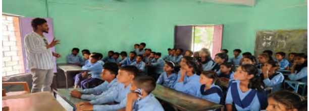
निज संवाददाता | कौआकोल (नवादा)

प्रखण्ड के राजकीय बुनियादी विद्यालय बरौन बाजितपुर में बाल संसद के गठन को लेकर बाल सभा का आयोजन किया गया। इस अवसर पर बच्चों को बाल संसद की संकल्पना, इसकी उपयोगिता एवं महत्व के बारे में विस्तारपूर्वक जानकारी दी गई। इस अवसर पर बच्चों को बाल संसद के सभी पदों जैसे कि प्रधानमंत्री, उपप्रधानमंत्री, शिक्षा मंत्री, स्वास्थ्य मंत्री, खेल मंत्री आदि के कर्तव्यों और जिम्मेदारियों के बारे में बताया।