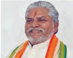
एसवीवी संवाददाता | औरंगाबाद

गुरुवार को औरंगाबाद स्थित अतिथि गृह में आयोजित हुई, जहां बिहार सरकार के सहकारिता मंत्री प्रेम कुमार ने विभाग द्वारा संचालित विभिन्न योजनाओं की गहन समीक्षा की। इस दौरान मंत्री ने सभी योजनाओं को समय पर पूरा करने का स्पष्ट निर्देश संबंधित अधिकारियों को दिया। बैठक में जन औषधि केन्द्र, कॉमन सर्विस सेंटर, किसान समृद्धि केन्द्र, विभिन्न सहकारी समितियों में क्रियान्वित योजनाएं, निर्माणाधीन गोदाम, तथा जिला में संचालित सर्वेकित सहकारी विकास परियोजना की व्यापक समीक्षा की गई। मंत्री ने अधिकारियों को निर्देशित किया कि योजनाओं की प्रगति में कोई ढिलाई न हो, और सभी कार्य निर्धारित समयसीमा में पूर्ण किए जाएं। मंत्री प्रेम कुमार ने यह भी कहा कि अंतरराष्ट्रीय सहकारिता वर्ष के अवसर पर आयोजित होने वाले कार्यक्रमों में सभी पदाधिकारी अपनी उपस्थिति सुनिश्चित करें, और इसके माध्यम से आमजन को सहकारिता विभाग द्वारा चलाई जा रही योजनाओं की जानकारी दी जाएगी।