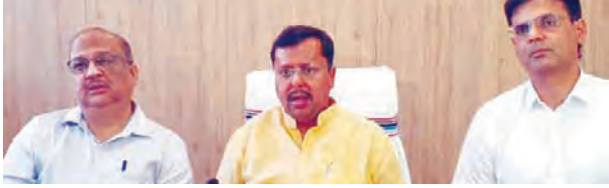
एक्सप्रेसवे से मिलेगी रफ्तार

बिहार में सड़क नेटवर्क को मजबूत और आधुनिक बनाने के लिए एक और बड़ा कदम उठाया गया है। पथ निर्माण मंत्री नितिन नवीन ने गुरुवार को जानकारी दी कि राज्य में 33,464 करोड़ रुपये की लागत वाली 52 राष्ट्रीय राजमार्ग परियोजनाओं को केंद्र सरकार से मंजूरी मिल गई है। यह निर्णय केंद्रीय सड़क परिवहन एवं राजमार्ग मंत्री नितिन गडकरी से हुई बैठक के बाद सामने आया, जिसमें 2025-26 की वार्षिक कार्य योजना पर चर्चा हुई। मंत्री नितिन नवीन ने बताया कि इन योजनाओं का उद्देश्य राज्य में बेहतर सड़क संपर्क, सुगम यातायात और सुरक्षित यात्रा सुनिश्चित करना है। प्रस्तावित योजनाओं में नए पुलों का निर्माण, पुराने पुलों का पुनरुद्धार, 18