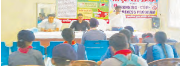
निज संवाददाता | बारूण (औरंगाबाद)