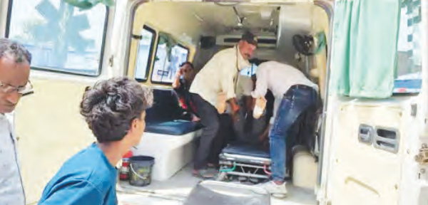
निज संवाददाता | नवीनगर (औरंगाबाद)

शनिवार को लाइब्रेरी से पढ़ाई कर घर वापस लौट रहे छात्र को रास्ते में रोक कर बदमाशों ने उस पर अटेक कर दिया। लाठी डंडे और लोहे के रॉड से हमला हुआ। लड़का गंभीर रूप से जखमी हो गया। मामला नवीनगर थाना क्षेत्र के चंद्रगढ़ गांव के पास का है।