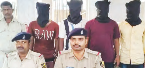
निज संवाददाता | पटना