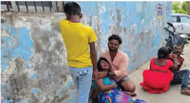
निज संवाददाता | अंबा (औरंगाबाद)