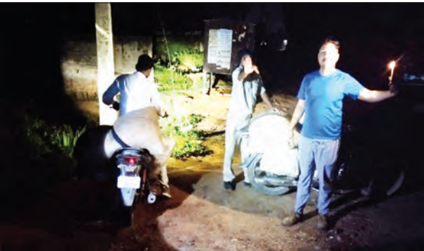
निज संवाददाता | रजौली (नवादा)