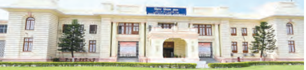
निज संवाददाता | पटना

पटना में इस साल मॉनसून में भारी बारिश के दौरान कई प्रमुख और संवेदनशील इलाके जलजमाव की चपेट में आ सकते हैं। शुक्रवार को महज आधे घंटे की बारिश ने ही राजधानी की सड़कों का हाल बेहाल कर दिया। शहर के निचले इलाकों में जहां जल जमाव ने आम जनजीवन को प्रभावित किया, वहीं प्रशासन की तैयारियों पर भी सवाल खड़े हो गए। पटना नगर निगम और बुडको द्वारा संयुक्त रूप से शहर के 33 ऐसे स्थानों की पहचान की गई है, जहां बारिश के दौरान गंभीर जलजमाव की संभावना जताई गई है। हैरानी की बात यह है कि इस सूची में विधानसभा, पटना हाई कोर्ट और जयप्रकाश नारायण अंतरराष्ट्रीय हवाई अड्डा जैसे महत्वपूर्ण और हाई-प्रोफाइल इलाके भी शामिल हैं। इसका सीधा असर आम लोगों के