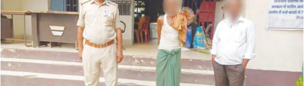
निज संवाददाता | हसपुरा (औरंगाबाद)

ने बताया कि पकड़ा गया अभियुक्त लंबे समय से अवैध शराब के धंधे में संलिप्त था और ग्रामीण क्षेत्रों में शराब की आपूर्ति करता था। गिरफ्तार व्यक्ति से पूछताछ जारी है, जिससे अन्य तस्करों के बारे में भी जानकारी मिलने की संभावना है। हसपुरा थाना द्वारा की गई इस कार्रवाई को स्थानीय लोगों ने सराहा है और पुलिस के प्रयासों की सराहना की है। औरंगाबाद पुलिस ने स्पष्ट किया है कि जिले में किसी भी