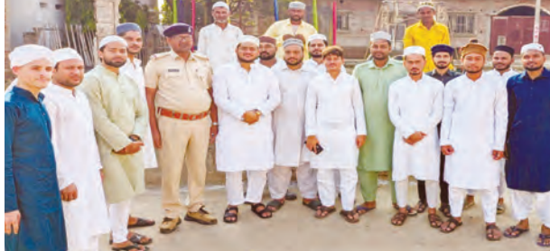
निज संवाददाता | रफीगंज (औरंगाबाद)

रखी गई थी। मस्जिदों और प्रमुख सार्वजनिक स्थलों पर दंडाधिकारी और पुलिस बल की तैनाती की गई थी ताकि शांति व्यवस्था बनी रहे और त्योहार में किसी प्रकार की बाधा न आए।