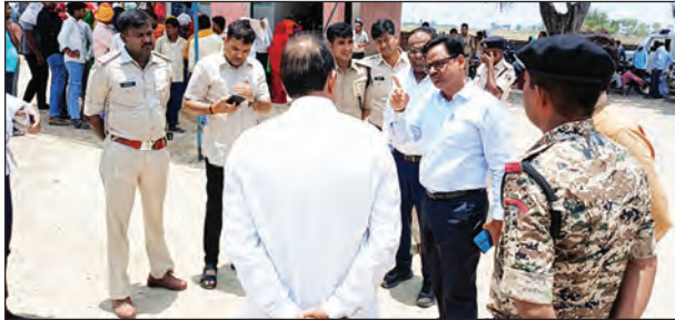
निज संवाददाता | करहगर (रोहतास)

करागहर प्रखंड अंतर्गत अररुआ व रींवा पंचायतों में गुरुवार को पैक्स चुनाव के तहत मतदान शांतिपूर्ण माहौल में संपन्न हुआ। दोनों पंचायतों में मतदाताओं में खासा उत्साह देखा गया, वहीं प्रशासनिक व्यवस्था भी चुस्त नजर आई। अररुआ पंचायत में दो प्रत्याशी अध्यक्ष पद के लिए आमने-सामने रहे, जबकि रींवा पंचायत में अध्यक्ष पद के लिए चार उम्मीदवारों के बीच मुकाबला हुआ। मतदान के बाद सभी प्रत्याशियों का भाग्य मतपेटियों में बंद हो गया। पैक्स सदस्यों के लिए भी मतदान की प्रक्रिया बिना किसी विघ्न के