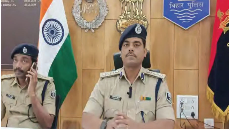
दिया है जो बीते वर्षों की अपेक्षा काफी सराहनीय कार्य माना जा सकता है।