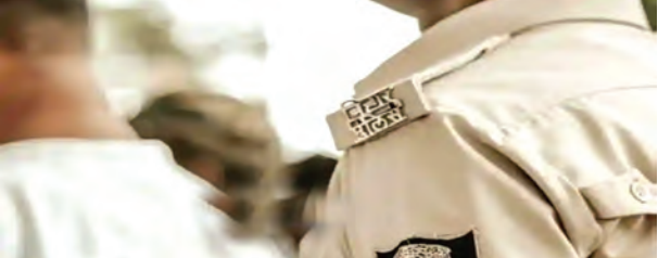
निज संवाददाता | पश्चिम चंपारण

चेतावनी दी है कि यदि सरकार इन समस्याओं पर ध्यान नहीं देती और आवश्यक कदम नहीं उठाती है, तो किसान आंदोलन करने के लिए बाध्य होंगे। संगठन ने यह भी कहा कि यदि सरकारी अधिकारी अपनी जिम्मेदारियों को निभाने में विफल रहते हैं, तो आंदोलन की विस्तृत रूपरेखा तैयार की जाएगी और संघर्ष को और तेज किया जाएगा। बैठक का समापन सभी सदस्यों को भारतीय किसान संघ के समर्थन में एकजुट रहने के आह्वान के साथ हुआ, ताकि किसानों की आवाज को मजबूती से उठाया जा सके।