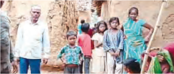
निज संवाददाता | मदनपुर (औरंगाबाद)