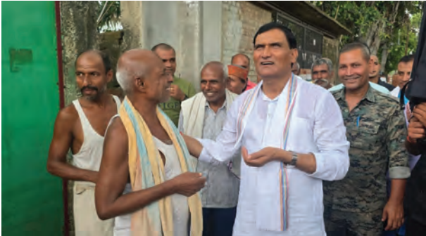
निज संवाददाता | नवादा