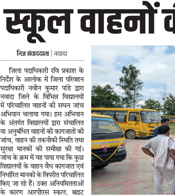
निज संवाददाता | नवादा