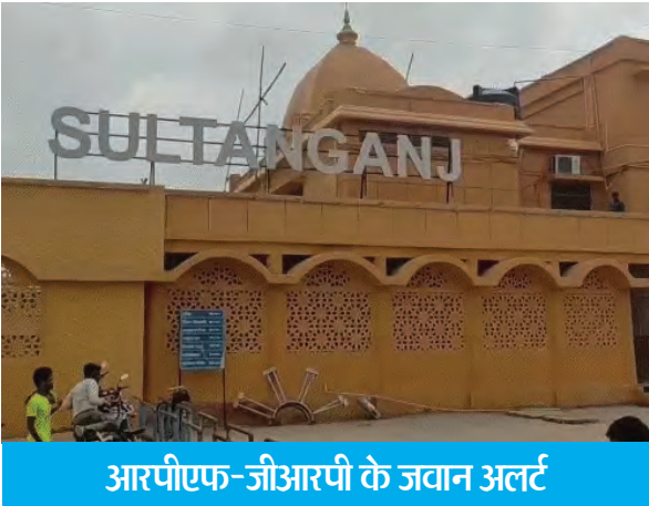
आरपीएफ-जीआरपी के जवान अलर्ट