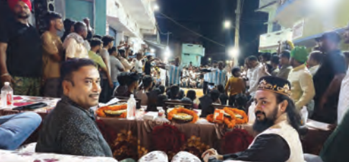
दाउदनगर (औरंगाबाद)