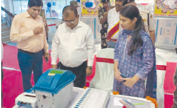
एसवीवी संवाददाता | औरंगाबाद

बुधवार को औरंगाबाद में आगामी बिहार विधानसभा आम निर्वाचन 2025 को लेकर मतदाताओं में जागरूकता बढ़ाने और उन्हें ईवीएम (इलेक्ट्रॉनिक वोटिंग मशीन) एवं वीवीपैट (वोटर वेरिफाइड पेपर ऑडिट ट्रेल) की कार्यप्रणाली से परिचित कराने के उद्देश्य से एक विशेष ईवीएम डेमोस्ट्रेशन सेंटर का उद्घाटन किया गया। इस डेमो सेंटर का उद्घाटन जिलाधिकारी सह जिला निर्वाचन पदाधिकारी श्रीकांत शास्त्री ने फीता काटकर किया। इस अवसर पर उन्होंने कहा कि यह केंद्र आम नागरिकों के लिए प्रतिदिन खुला रहेगा, जहां वे ईवीएम और वीवीपैट के माध्यम से मतदान की प्रक्रिया