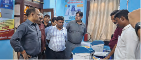
निज संवाददाता। सहरसा

आगामी बिहार में विधानसभा आम निर्वाचन- 2025 के क्रम में मतदाताओं के बीच ईवीएम तथा वीवीपेट के संबंध में जागरूकता का प्रसार करने हेतु जिलांतर्गत सहरसा एवं सिमरी बख्तियारपुर में समेकित रूप से दो प्रदर्शन केंद्रों ईवीएम डेमोन्स्ट्रेशन सेंटर ईडीसी की स्थापना की गई है।उक्त वर्णित प्रदर्शनी केंद्र में बैलट यूनिट, कंट्रोल यूनिट एवं वीवीपेट उपलब्ध कराये गये हैं। साथ ही ईवीएम के जानकार कर्मियों की प्रतिनियुक्ति की गई है।