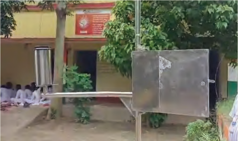
निज संवाददाता। जहानाबाद