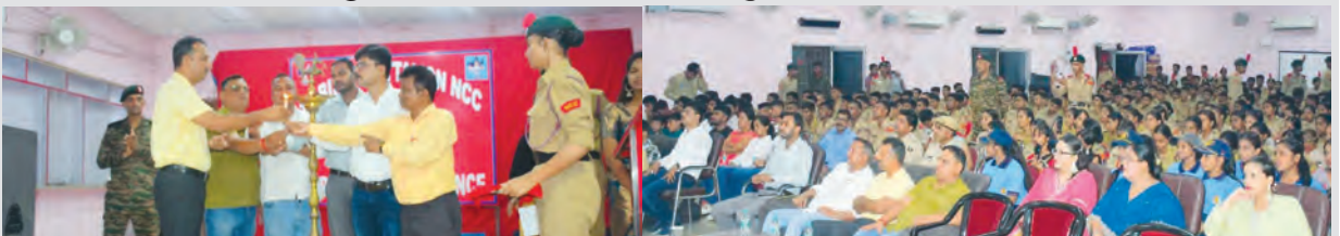
एसवीवी संवाददाता | औरंगाबाद

एसच्चिदानंद सिन्हा कॉलेज, औरंगाबाद में 26 जुलाई से आरंभ हुआ एनसीसी का संयुक्त वार्षिक प्रशिक्षण शिविर (सीएटीसी-XII) सोमवार को गरिमामय ढंग से संपन्न हो गया। 13 बिहार बटालियन एनसीसी औरंगाबाद के तत्वावधान में आयोजित इस 10 दिवसीय शिविर में जिले भर के विभिन्न विद्यालयों और महाविद्यालयों से सैकड़ों कैडेटों ने भाग लिया। अंतिम दिन सुबह सभी कैडेटों ने पीटी अभ्यास के साथ दिन की शुरुआत की। शिविर की पूर्व संंध्या पर