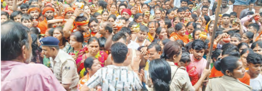
निज संवाददाता | गोह (औरंगाबाद)

सावन की अंतिम सोमवारी को लेकर गोह प्रखंड के देवकुंड स्थित प्राचीन शिव मंदिर बाबा दूधेश्वरनाथ धाम में आस्था का जन्मसंलाब उमड़ पड़ा। श्रद्धा, भक्ति और शिवभक्ति से सराबोर यह दृश्य सोमवार को अभूतपूर्व बन गया, जब एक लाख से अधिक शिवभक्तों ने मंदिर पहुंचकर बाबा पर जल अर्पण किया और सुख-शांति की कामना की। रविवार की रात से ही मंदिर परिसर श्रद्धालुओं से भरने लगा था। रात करीब एक बजे से दर्शन की कतारें