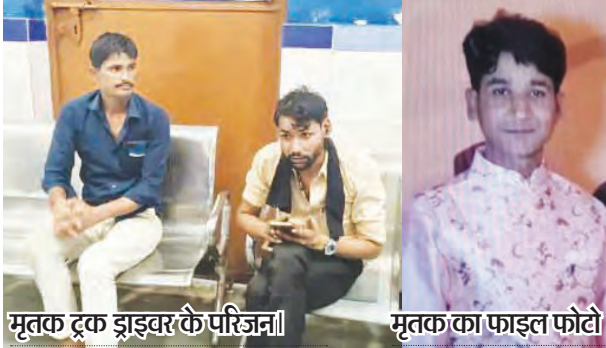
मृतक ट्रक ड्राइवर के परिजन।