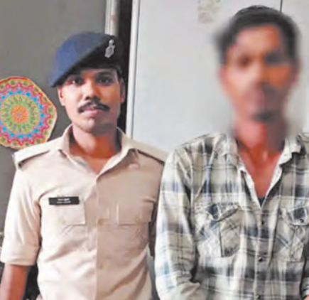
किशनगंज, एजेंसी। किशनगंज के कोचाधामन थाना क्षेत्र में हुए रेप मामले में पुलिस ने मात्र 24 घंटे के

आंगनवाड़ी केंद्र में घटना को दिया था अंजाम, फरार आरोपी की तलाश जारी