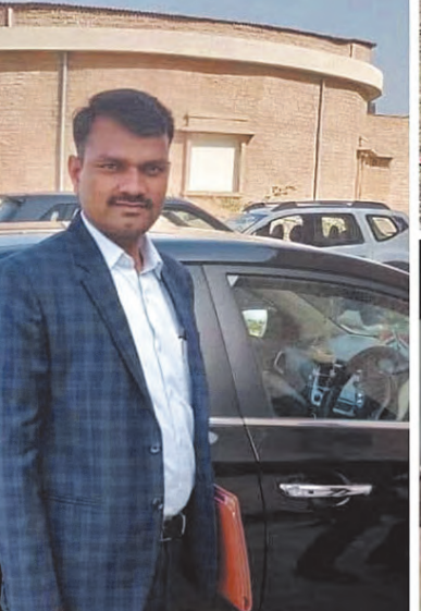
आरोपी न सिर्फ वहीं में था बल्कि उसके