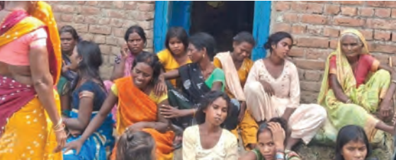
निज संवाददाता। गुरुआ

किया गया ताकि समुदाय स्तर पर भी हरियाली को बढ़ावा दिया जा सके। इस अवसर पर वक्ताओं ने कहा कि यह सिर्फ एक दिवस नहीं है, बल्कि वह बीज है, जो आने वाले समय में संवेदना, संरक्षण एवं पर्यावरण प्रेम के घने वृक्ष का रूप लेगा।