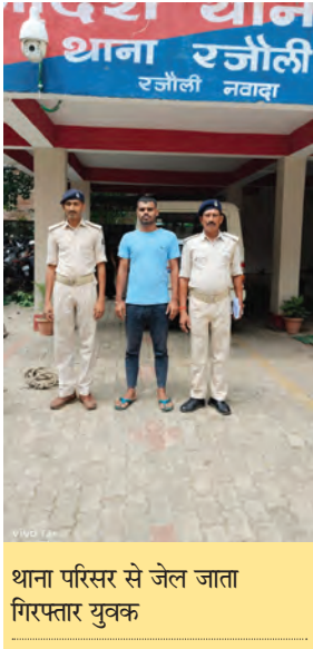
थाना परिसर से जाल जाता गिरफ्तार युवक