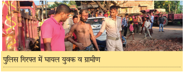
पुलिस गिरफ्त में घायल युवक व ग्रामीण