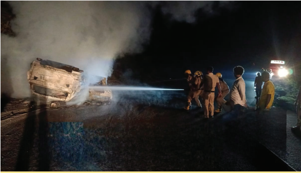
कार में लगी आग पर काबू पाते अग्निशमन कर्मी