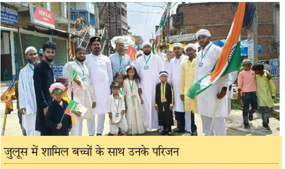
जुलूस में शामिल बच्चों के साथ उनके परिजन