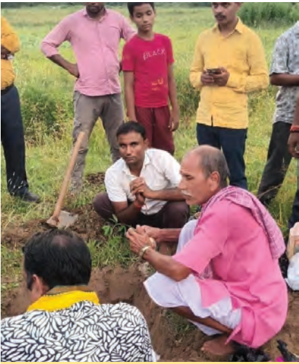
भूमि पूजन में जुटे संवेदक एवं ग्रामीण