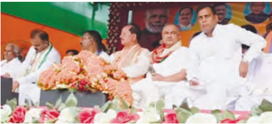
लोकतंत्र में जनता ही तय करेगी देश की बागडोर

सभा को संबोधित करते हुए उपमुख्यमंत्री विजय कुमार सिन्हा ने महागठबंधन पर करारा हमला बोला। उन्होंने कहा कि राजद और कांग्रेस के लोग परिवारवाद की राजनीति करते हैं, जहां युवराज को बिना अनुभव के जनता के सामने नेता बनाकर पेश किया जा रहा है। उन्होंने कटाक्ष करते हुए कहा, “रानी के पेट से राजा पैदा नहीं होगा। लोकतंत्र में देश की जनता ही अपना राजा चुनेगी।” विजय सिन्हा ने कहा कि राहुल गांधी और तेजस्वी यादव जैसे नेता, जिनके माता-पिता मुख्यमंत्री और प्रधानमंत्री रह चुके हैं, उन्हें जनता की समस्याओं को समझने के लिए जमीन पर उतरकर काम करना चाहिए था। लेकिन ये लोग यह मानकर चलते हैं कि केवल परिवार में जन्म लेने से ही उन्हें सत्ता का अधिकार मिल जाएगा। उन्होंने संविधान निर्माता डॉ. भीमराव अंबेडकर के कथन का उल्लेख करते हुए कहा कि लोकतंत्र में जनता ही सर्वोपरि है, वही देश की बागडोर तय करती है।