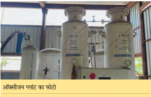
ऑक्सीजन प्लांट का फोटो

लागत से अनुमंडलीय अस्पताल में वर्ष 2021 में ऑक्सीजन जेनरेशन प्लांट स्थापित किया गया था।साथ ही अस्पताल के सभी 75 बेडों पर पाइप के जरिए ऑक्सीजन की सप्लाई की जा रही थी।किंतु ऑक्सीजन जेनरेशन प्लांट से सप्लाई होने वाले पाइप में महज कुछ दिनों बाद एक लीकेज हो गया,जिसकी मरम्मती आजतक नहीं करवाई गई है।इस कारण प्लांट को चलाने वाला टेक्नीशियन भी बीते लगभग 6 महीनों से अस्पताल से परार है।इसका खामियाजा अस्पताल आनेवाले गंभीर रूप से बीमार और सड़क दुर्घटना में घायल मरीजों को