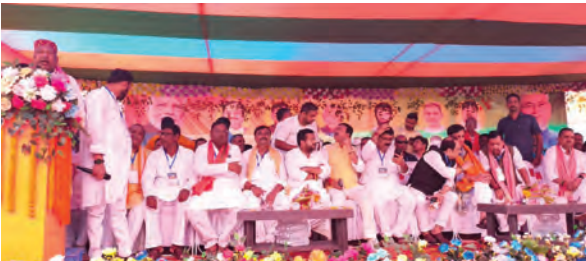
मंच पर आसीन मंत्रीगण एवं नेतागण