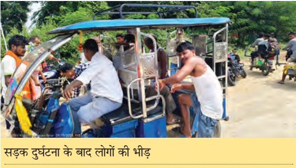
सड़क दुर्घटना के बाद लोगों की भीड़

रजौली। थाना क्षेत्र के बांके मोड़ से लेकर हरदिया तक प्रतिदिन टोटो समेत सैकड़ों वाहन रॉंग साइड में चलते हैं।रॉंग साइड में चलने के कारण आए दिन सड़क दुर्घटनाएं होते रहती है।कई बार सड़क दुर्घटना सामान्य होती है,किंतु कभी-कभी सड़क दुर्घटना बहुत ही भयावह हो जाती है।शुक्रवार को अनुमंडल कार्यालय से महज 300 मीटर दूरी पर एक स्कूटी पर सवार रहे वृद्ध को सामने से रॉंग साइड में आ रहे एक अज्ञात टोटो ने जोरदार टक्कर मार दी।इस टक्कर में स्कूटी सवार वृद्ध गंभीर रूप से घायल हो गए एवं उनका दाएं हाथ की कलाई टूट गई।स्थानीय लोगों एवं राहगीरों की मदद से घायल वृद्ध को इलाज हेतु अनुमंडलीय अस्पताल में भर्ती