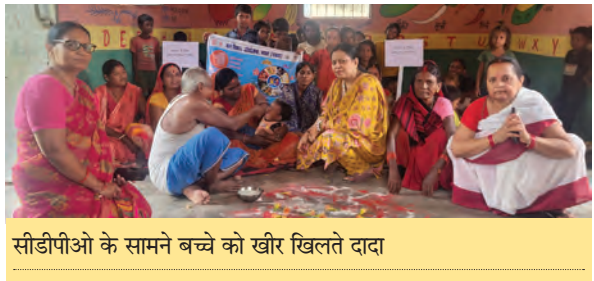
सीडीपीओ के सामने बच्चे को खीर खिलते दादा

किया जाए। उन्होंने यह भी कहा कि चापाकल मरम्मत की सूचना समय पर जनप्रतिनिधियों तक अवश्य पहुंचे। माननीय सांसद महोदय ने स्वास्थ्य सेवाओं की मजबूती को अत्यंत महत्वपूर्ण बताते हुए कहा कि सदर अस्पताल एवं सभी पीपेचसी में आवश्यक सुविधाएं उपलब्ध कराई जाएं। उन्होंने निर्देश दिया कि जन औषधि केन्द्र स्थापित किए जाएं ताकि जरूरतमंद एवं असहाय रोगियों को सस्ती दवाएं मिल सकें। उन्होंने यह भी कहा कि आपातकालीन सेवाओं को दुरुस्त रखा जाए और एम्बुलेंस की उपलब्धता हर समय सुनिश्चित हो जिससे किसी भी आपात स्थिति में रोगियों को तत्काल सुविधा मिल सके।बैठक में विद्युत विभाग से संबंधित कई मुद्दों पर भी चर्चा हुई। सांसद महोदय ने सभी खुले तारों को सुरक्षित करने और खराब पड़े ट्रांसफॉर्मरों की त्वरित मरम्मत कराने का निर्देश दिया। कार्यपालक अभियंता ने जानकारी दी कि बुधौल नवादा से खराब ग्रिड तक 13.1 कि.मी., खनवां ग्रिड से सिरदला तक 17.0 कि.मी. एवं वारिसलीगंज ग्रिड से वारिसलीगंज