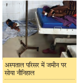
अस्पताल परिसर में जमीन पर सोया नौनिहाल

अस्पताल प्रबंधन की जिम्मेदारी :- अस्पताल प्रबंधन को इस स्थिति को सुधारने के लिए तत्काल कदम उठाने होंगे।वर्चुअल बेड की मरम्मत और नए बेड की व्यवस्था करना जरूरी है,ताकि