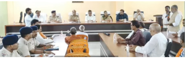
एसवीवी संवाददाता | औरंगाबाद

आगामी दुर्गा पूजा को सुरक्षित और शांतिपूर्ण ढंग से संपन्न कराने के लिए जिलाधिकारी और पुलिस अधीक्षक औरंगाबाद के नेतृत्व में नगर परिषद दाउदनगर में स्थानीय गणमान्य लोगों के साथ संयुक्त शांति समिति की बैठक आयोजित की गई। बैठक में विभिन्न मंदिरों और पूजा पंडालों के आसपास सुरक्षा, यातायात