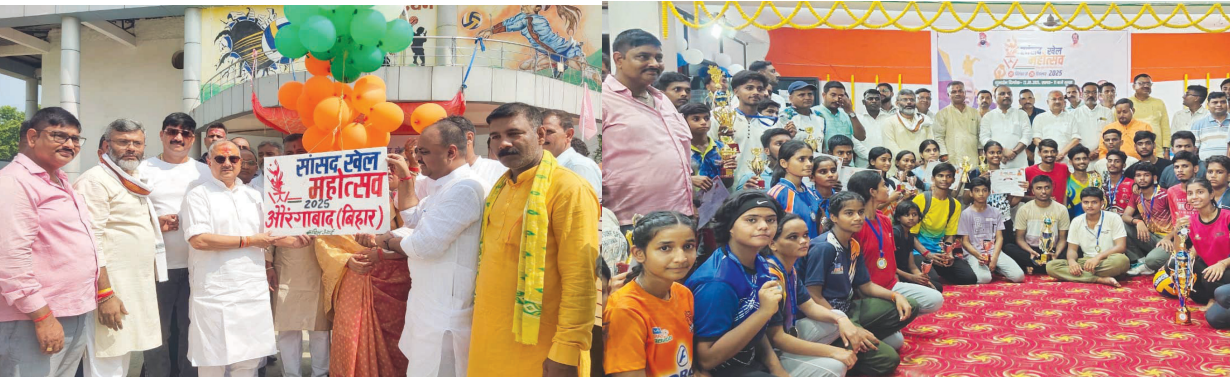
औरंगाबाद