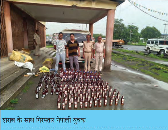
शराब के साथ गिरफ्तार नेपाली युवक