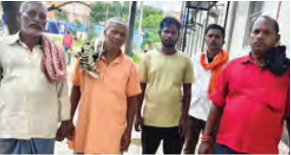
निज संवाददाता। आरा

भारत के राष्ट्रपति के तरफ से निम्न कार्य हेतु ई-निविदा आमंत्रित की जाती है। (1) कार्य का नाम: दरमंगा रेलवे स्टेशन के मेजर अपग्रेडेशन कार्य हेतु, समस्तीपुर मंडल, पूर्व मध्य रेलवे में इंजीनियरिंग, प्रोक्योरमेंट एवं कंस्ट्रक्शन (EPC) आधार पर परियोजना प्रबंधन सेवाएँ प्रदान करने के लिए प्राधिकृत अभियंता की नियुक्ति हेतु निविदा आमंशण जाफ़: रु.4,50,900.00, (4) ग्री-बीड मीटिंग तिथि: 26 09.2025 15:30 बजे, (5) निविदा बंद होने की तिथि एवं समय: 24.10.2025 15:00 बजे, (6) वेबसाइट का विवरण, नोटिस बोर्ड जहाँ पर निविदा का पूर्ण विवरण देखा जा सकता है तथा कार्यालय का पता जहाँ पर निविदा प्रपत्र खरीदा जा सकता है इत्यादि: उपरोक्त ई-निविदा के ई-निविदा दस्तावेज सहित संपूर्ण जानकारी वेबसाइट http://www.ireps.gov.in पर उपलब्ध होंगे एवं मुख्य प्रशासनिक अधिकारी/ निर्माण/उत्तर/पुर्न/महेन्द्रगढ़, पटना के कार्यालय में देखा जा सकता है। दृष्टव्य: निविदा सूचना में पाए गए किसी भी विसंगति विवरण के मामले में अंग्रेजी संस्कारण ही मान्य होगा। [प्रत्याशित निविदाकारों को यह सलाह दी जाती है कि इस ई-निविदा के लिए जारी कोई भी परिवर्तन/शुद्धिपत्र की ओर ध्यान देने के लिए वे निविदा बंद होने की अंतिम तिथि से कम से कम पंद्रह दिन पहले वेबसाइट http://www.ireps.gov.in का अवलोकन करें। मुख्य प्रशासनिक अधिकारी/निर्माण पूर्व मध्य रेलवे, महेन्द्रगढ़, पटना। पीआर/1010/सीएन/एन/एनएनएन/सीओएनएन/टी/25-26/44