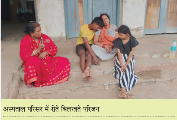
अस्पताल परिसर में रोते बिलखते परिजन