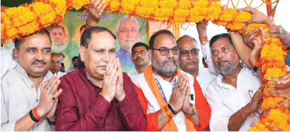
निज संवाददाता | रफीगंज (औरंगाबाद)