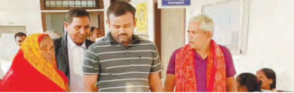
एसवीवी संवाददाता | औरंगाबाद

अपराध की सजा व्यवहार न्यायालय, औरंगाबाद की एडीजे-2 आनंदिता सिंह ने मंगलवार को सुनाई। बारूण थाना कांड संख्या-267/21 में दोनों पक्षों के अधिवक्ताओं को सुनने के बाद न्यायालय ने दोनों अभियुक्तों को एनडीपीएस एक्ट की धारा 20(बी-2) की से तहत 12 साल सश्रम कारावास और एक लाख रुपए जुर्माना लगाया। जुर्माना न देने की स्थिति में अतिरिक्त छह महीने का कारावास भी तय किया गया। स्पेशल पीपी परवेज अख्तर ने बताया कि बरामद गांजा 20 किलो 51 किलो था, जो व्यावसायिक मात्रा