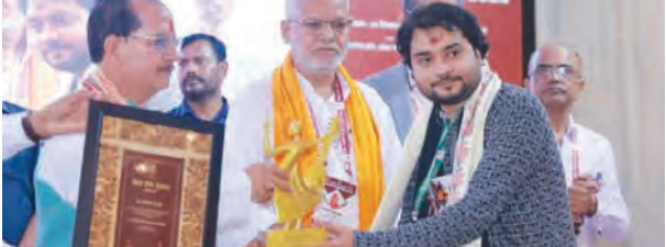
एसटीवी संवाददाता | औरंगाबाद

समस्या पर काबू पाने में मदद मिलेगी। पटना में जाम की समस्या रोजमर्रा की परेशानी बन गई है। शहर के चौक-चौराहों पर ऑटो/ई-रिक्शा का जमावड़ा और अनियंत्रित यातायात के कारण अक्सर यात्री परेशान रहते हैं। नए जोन और रूट योजना से यह समस्या कम होने की उम्मीद है। बैठक में यह भी निर्णय लिया गया कि प्रत्येक जोन में यातायात पुलिस और निगरानी अधिकारियों की उपस्थिति बढ़ाई जाएगी। यह कदम न केवल यातायात को नियंत्रित करेगा बल्कि यात्रियों की सुरक्षा और नियमों के पालन को सुनिश्चित करेगा।