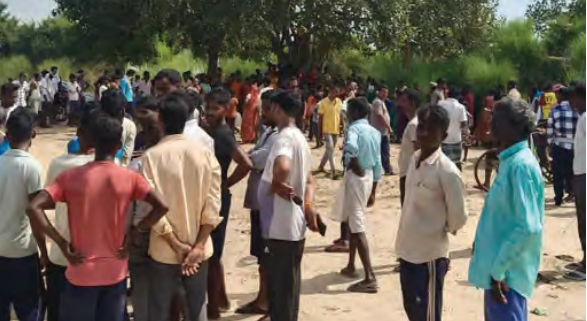
निज संवाददाता। गयाजी