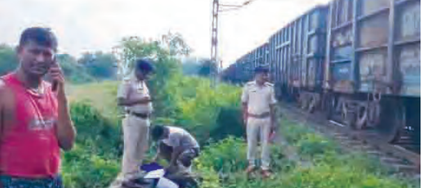
निज संवाददाता | रफीगंज (औरंगाबाद)

जिला के विभिन्न थाना क्षेत्रों में अपराध नियंत्रण और मध्यनिषेध कानून के प्रभावी क्रियान्वयन के लिए सघन वाहन जांच अभियान चलाया जा रहा है। इस कार्रवाई का उद्देश्य अपराधियों की गतिविधियों पर नजर रखना और कानून के उल्लंघन को रोकना है। पुलिस अधिकारियों ने बताया कि इस दौरान प्रमुख सड़कों, बस स्टैंड, बाजार और अन्य संवेदनशील क्षेत्रों में वाहनों की जांच की जा रही है। संदिग्ध वाहनों और व्यक्तियों की जांच के साथ-साथ आवश्यक कानूनी कार्रवाई भी की जा रही है। जिले में इस तरह की सघन जांच से अपराध और अवैध गतिविधियों पर कड़ी नजर रखने में मदद मिलेगी और आम जनता में सुरक्षा की भावना मजबूत होगी।