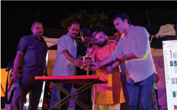
निज संवाददाता। गयाजी