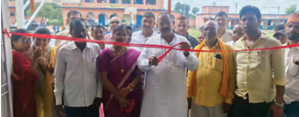
निज संवाददाता। मानपुर

गयाजी शहर के गया क्लब परिसर में नवरात्रि के अवसर पर शुक्रवार रात एएसडी इवेंट के द्वारा पहला डांडिया नाइट का भव्य आयोजन किया गया। पारंपरिक और आधुनिक संगीतों के दोनों पर सजे-धजे लोगों ने देर रात तक गरबा और डांडिया का भरपूर आनंद लिया। कार्यक्रम का शुभारंभ आरती और दीप प्रज्वलन से हुआ। इसके बाद मंच पर रंग-बिरंगे परिधानों में