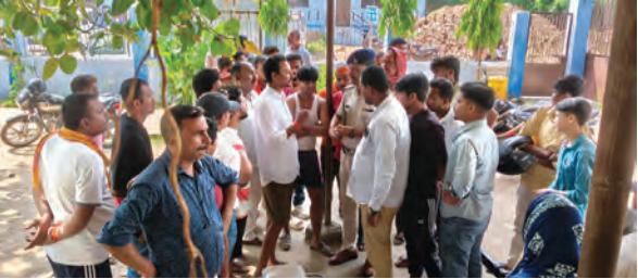
निज संवाददाता रोहतास