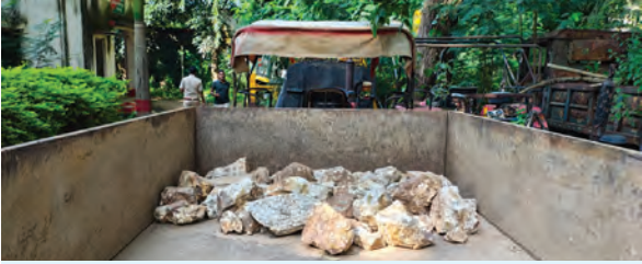
जब्त ट्रैक्टर पर लदा उजला पत्थर

थाना क्षेत्र के सुदुरवर्ती पंचायत सवैयाटांड के चटकरी गांव स्थित शारदा नामक अभ्रक माइंस में अवैध खनन के विरुद्ध वन विभाग ने बीते गुरुवार की देर रात बड़ी कार्रवाई की है। वन विभाग की टीम ने मौके से उजले रंग के बड़े-बड़े पत्थरों से लदे एक ट्रैक्टर को जिनत किया है और साथ ही ट्रैक्टर चालक सह मालिक को भी गिरफ्तार कर लिया। यह कार्रवाई काफी दिनों बाद हुई है। दर्जनों माइंस में जारी है अवैध ब्लैस्टिंग और खनन:- सवैयाटांड पंचायत में शारदा अभ्रक माइंस के अतिरिक्त दर्जनों अन्य अभ्रक माइंस भी हैं, जहां दिन के उजाले से लेकर रात में भी जिलेटिन व डेटोनेटर से ब्लैस्टिंग कर अभ्रक का अवैध खनन धड़ल्ले से जारी है। ठेकेदार ब्लैस्टिंग के बाद मजदूरों से अभ्रक चुनवाते हैं और उन्हें बहुत कम राशि देते हैं, जबकि ठेकेदार इसी अभ्रक को बाजार में