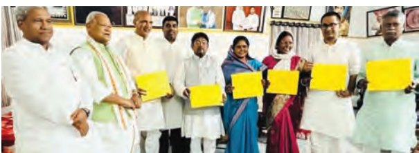
निज संवाददाता | पटना

बिहार विधानसभा चुनाव 2025 को लेकर भारत निर्वाचन आयोग ने सख्त दिशा-निर्देश जारी किए हैं। आयोग ने स्पष्ट किया है कि अब किसी भी राजनीतिक दल या प्रत्याशी को सोशल मीडिया या इलेक्ट्रॉनिक माध्यमों पर प्रसारित होने वाले किसी