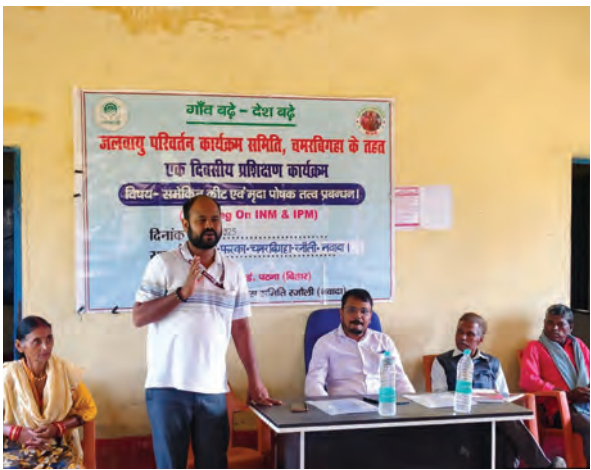
प्रशिक्षण के दौरान डीडीएम के साथ समिति के सदस्य