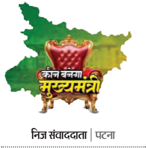
निज संवाददाता | पटना