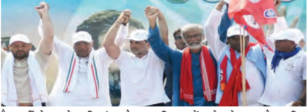
निज संवाददाता | पटना

बिहार विधानसभा चुनाव 2025 के लिए महागठबंधन में सीट शेयरिंग का औपचारिक ऐलान अभी बाकी है, लेकिन राज्य के सबसे बड़े वामपंथी दल सीपीआई (माले) ने अपने 18 उम्मीदवारों की लिस्ट जारी कर दी है। पार्टी ने अपने अधिकशा मौजूदा विधायकों को दोबारा मौका दिया