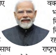
एसे समय पर हो रही है जब भारत

प्रधानमंत्री नरेन्द्र मोदी ने भारत को मंगोलिया के विकास में मजबूत और विश्वसनीय साझेदार बताते हुए दोनों देशों के बीच राजनयिक संबंधों के 70 वर्ष पूरे होने के मौके पर मंगोलिया के नागरिकों के लिए निशुल्क ई-वीजा की घोषणा की है। श्री मोदी ने भारत की यात्रा पर आए मंगोलिया के राष्ट्रपति हुरेलसुख उखना के साथ यहां द्विपक्षीय वार्ता के बाद संयुक्त