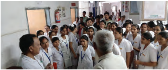
अस्पताल में कर्मियों से बातचीत करते सिविल सर्जन

में भी सीसीटीवी कैमरा नहीं लगा है। जिससे चोरों की पहचान करना पुलिस के लिए बड़ी चुनौती बन गयी है। स्थानीय लोगों ने सुरक्षा व्यवस्था पर सवाल उठाते हुए कहा कि लगातार चोरी की घटनाओं के बावजूद बाजार क्षेत्र में निगरानी के पर्याप्त इंतजाम नहीं किए गए हैं। बता दें कि जिले में अपराधिक घटनाएं बढ़ती जा रही है। बेखोफ अपराधी एक के बाद एक अपराधिक घटनाओं