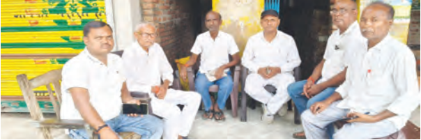
एसवीवी संवाददाता | औरंगाबाद

25-26 नवंबर को धूमधाम से मनाया जाएगा दो दिवसीय सीताथापा महोत्सव