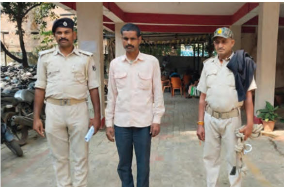
थाना परिसर से जेल जाता गिरफ्तार युवक