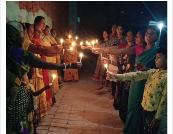
निज संवाददाता। कौआकोल

बिहार विधानसभा चुनाव के तहत नवादा जिला में 11 नवम्बर को होने वाले मतदान को लेकर लोगों को मतदान के प्रति जागरूक करने के लिए जीविका दीदियों ने अद्भुत पहल की शुरुआत किया है। कौआकोल प्रखंड की जीविका दीदियों ने अद्भुत पहल करते हुए मतदाता जागरूकता अभियान चलाया। इस दौरान जीविका दीदियों ने गाँव-गाँव में दीपक