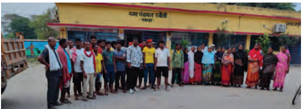
नगर पंचायत कार्यालय के समीप खड़े सफाईकर्मी

इसके रजौली नगर पंचायत प्रशासन सफाई व्यवस्था पर कोई ध्यान नहीं दे रहा है।नागरिकों ने सवाल उठाया कि ‘स्वच्छता अभियान’ के दौरान कुर्ते-पजामे वाले लोग हाथों में झाड़ू लेकर दर्जनों पोज में फोटो खिंचवाते हैं और इसे श्रमदान का नाम दिया जाता है।लेकिन आज जब रजौली की जनता गंदगी में है, क्या वे ‘श्रमदान’ के लिए आगे आकर साफ-सफाई में जुटेंगे।यह सवाल नगर के दर्जनों लोगों के मन में घूम रहा है।सफाईकर्मियों की मांग है कि त्यौहार से पूर्व जल्द से जल्द उन्हें उनके बकाया वेतन का भुगतान किया जाए, ताकि वे भी अपने परिवार के साथ खुशियां मना सकें।