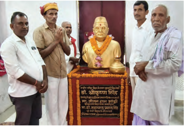
श्रीबाबू के प्रतिमा पर श्रद्धासुमन अर्पित करते ग्रामीण