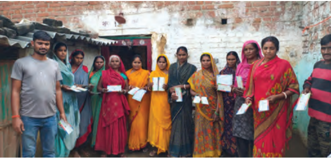
हाथों में पासबुक और फिक्स डिपोजिट कागजात रखे ग्रामीण