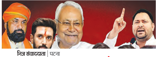
निज संवाददाता | पटना