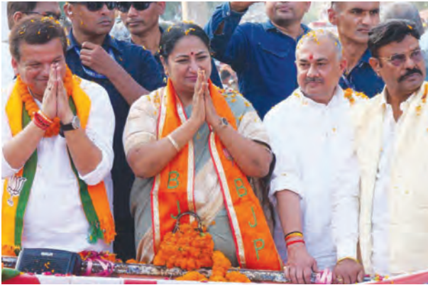
एसवीवी संवाददाता | औरंगाबाद

समर्थकों ने जेसीबी से बरसाए फूल, उमड़ा जनसैलाब, कहा: विकास और शिक्षा के नाम पर दें वोट