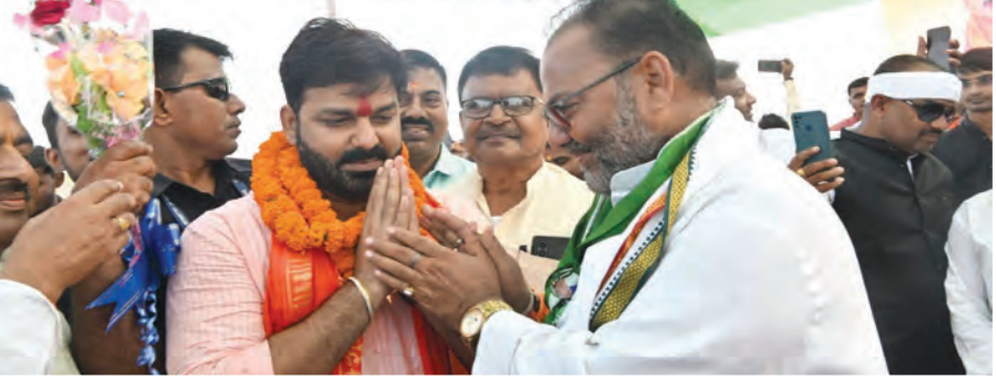
निज संवाददाता | रफीगंज (औरंगाबाद)