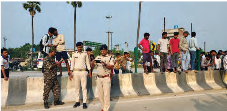
घटनास्थल पर थानाध्यक्ष

थाना क्षेत्र के बांके मोड़ के समीप बुधवार की दोपहर को अज्ञात हाइवा ट्रक ने एक साइकिल सावर अधेड़ को कुचल दिया।सड़क दुर्घटना के बाद अधेड़ का शव सड़कों पर टुकड़ों में बिखरा गया।दुर्घटना स्थल से लगभग 200 मीटर तक अधेड़ साइकिल के साथ सड़क पर घसीटता हुआ गया था।मृतक का शरीर दो भागों में बंट गया है एवं सिर भी कुचला जा चुका है।शरीर की जांच करने पर एक हाथ में सुनो देवी लिखा हुआ मिला है।मृतक की पहचान में ग्रामीण और पुलिस दोनों जुट हुए हैं,किंतु खबर लिखे जाने तक पहचान नहीं हो पाई है।स्थानीय लोगों के द्वारा पुलिस को घटना की सूचना दी गई।सूचना पर पहुंची पुलिस ने शव के टुकड़ों को जमा करके पोस्टमार्टम हेतु सदर अस्पताल नवादा भेजा गया है।