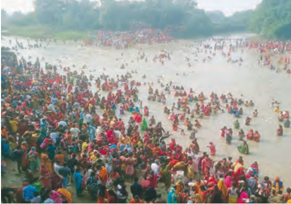
आयोजित होता आ रहा है।