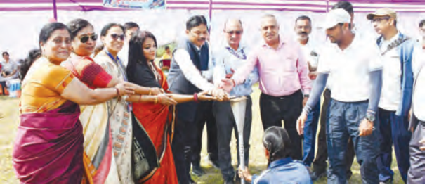
निज संवाददाता | नवीनगर औरंगाबाद

और ब्रेक डांस आकर्षण का केंद्र बने रहे। वैवाहिक साज-सज्जा से लेकर घरेलू सामान, फर्नीचर और कृषि औजारों की बिक्री भी जोरों पर रही। कृषक बंधु धान काटने वाले औजार खरीदने नजर आए। जम्होर का कार्तिक पूर्णिमा मेला धार्मिक और व्यावसायिक दोनों दृष्टि से अत्यंत महत्वपूर्ण माना जाता है। लोग हर साल बड़ी संख्या में यहां पहुंचकर आस्था के साथ-साथ खरीदारी का आनंद लेते हैं।