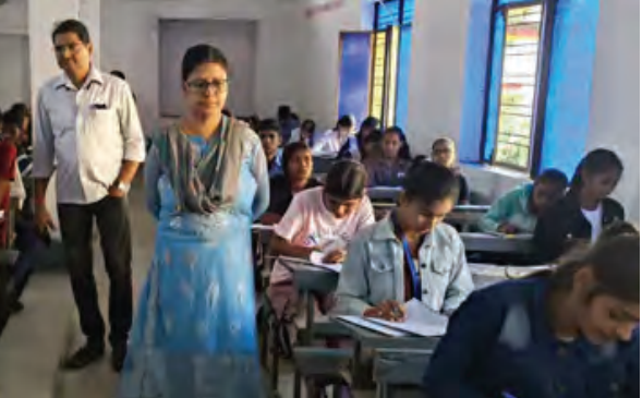
निज संवाददाता। आरा

डॉ. नेमीचन्द्र शास्त्री बालिका उच्च विद्यालय में क़ैश कोर्स के द्वितीय चरण की परीक्षा आयोजित की गई। इस परीक्षा में प्रथम चरण में चयनित 150 विद्यार्थियों ने भाग लिया। तीन घंटे की परीक्षा में मैथ, सोशल साइंस, हिंदी और संस्कृत से सवाल पूछे गए थे। इन 150 विद्यार्थियों में से सर्वश्रेष्ठ 40 विद्यार्थियों (सुपर -40) का चयन किया जाएगा। चयनित विद्यार्थियों की विशेष तैयारी राष्ट्रीय कन्या उच्च विद्यालय, आरा में दो माह की अवधि तक कराई जाएगी, जहां जिला के अनुभवी शिक्षकों द्वारा बिहार विद्यालय परीक्षा समिति की वार्षिक माध्यमिक परीक्षा सत्र 2025-26 की तैयारी कराई जाएगी। इस क़ैश कोर्स कार्यक्रम का उद्घाटन 25 नवम्बर 2025 को किया जाएगा। यह कार्यक्रम वर्ष 2022 में तत्कालीन जिला शिक्षा पदाधिकारी द्वारा प्रारंभ किया गया था। वर्तमान