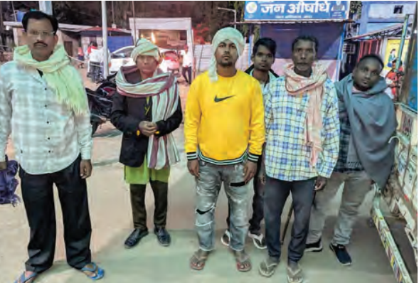
निज संवाददाता। आरा

बिहार की उन्नति के लिए की प्रार्थना: स्वामी जी ने मानव कल्याण और बिहार की उन्नति के लिए जो मंगल कामना की है, वह हमारे लिए प्रेरणादायक है। मानव कल्याण की सेवा हमारी संस्कृति की मूल पहचान है और इसे आगे बढ़ाना हम सभी का कर्तव्य है।” इस अवसर पर बड़ी संख्या में स्थानीय श्रद्धालु भी मौजूद रहे। सभी ने स्वामी जी के प्रवचन को सुना और केंद्रीय मंत्री का स्वागत किया। पूरे कार्यक्रम के दौरान आश्रम परिसर में आध्यात्मिक वातावरण और श्रद्धा का माहौल बना रहा।