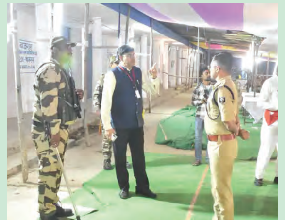
निज संवाददाता। बक्सर