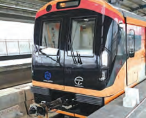
निज संवाददाता | पटना

पटना मेट्रो कॉरिडोर वन में टनल की खुदाई से पहले मिट्टी की जांच शुरू की गई है। ताकि यह जानकारी मिल सके कि कहां की मिट्टी किस तरह की है। इसके लिए रकनपुरा से पटना जंक्शन के बीच 12 जगहों पर 50 मीटर अंदर तक बोरिंग की जा रही है। जिसके माध्यम से हर एक मीटर की मिट्टी बाहर निकाल कर जांच के लिए लैब में भेजी जाएगी। मेट्रो से मिली जानकारी के अनुसार 50 से अधिक जगहों पर नेहरू पथ के दोनों किनारे मिट्टी की जांच होनी है। इसी के आधार पर जमीन के अंदर टनल के लिए मार्ग तैयार किया जाएगा। टनल खुदाई के लिए जनवरी में पहुंचेगी दो टीबीएम मेट्रो की ओर से पटना जंक्शन से रकनपुरा और मीठापुर तक 9.35 किमी में टनल तैयार होना है। इस कॉरिडोर में टनल तैयार करने के लिए आठ टनल बोरिंग मशीन (टीबीएम)