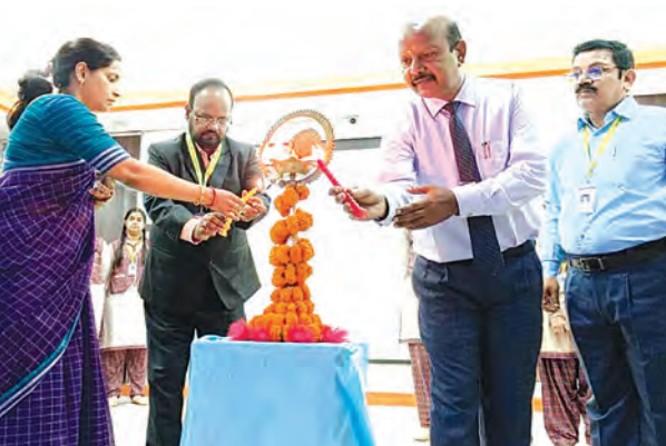
एसवीवी संवाददाता | औरंगाबाद