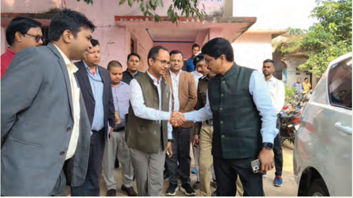
निदेशक और डीएम के साथ अन्य पदाधिकारी

जनगणना 2011 के 15 वर्षों बाद वर्ष 2027 में जनगणना कार्य किया जाना है।उन्होंने जनगणना के देरी होने की मुख्य वजह कोविड-19 महामारी बताया है।साथ ही कहा कि वर्ष 2027 में होने वाली जनगणना को लेकर प्रशासनिक तैयारियां