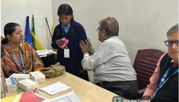
निज संवाददाता। सिरदला, नवादा