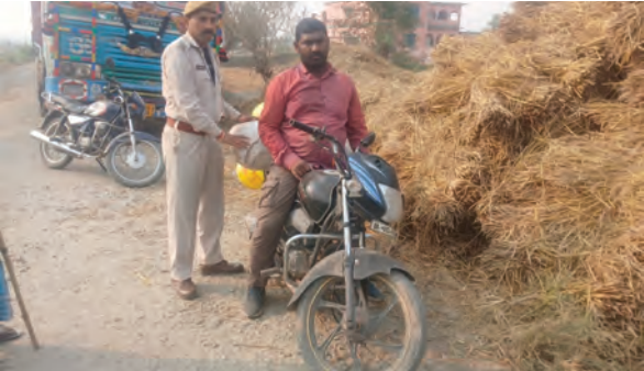
निज संवाददाता। मसौड़ी