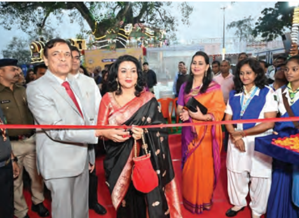
निज संवाददाता। सोनपुर,पटना

तस्करी की सूचना मिल रही थी। इसके आधार पर एक विशेष टीम बनाई गई और कार्रवाई की गई। गिरफ्तार युवकों से यह जानकारी जुटाई जा रही है कि वे नशीला पदार्थ कहां से लाते थे, कब से कारोबार चला रहे थे और इसका नेटवर्क कितना बड़ा है। पुलिस इस गिरोह से जुड़े अन्य सदस्यों की तलाश में भी जुटी है। अधिकारियों का कहना है कि पूछताछ से पूरे नेटवर्क को ध्वस्त करने में मदद मिल सकती है।