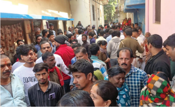
निज संवाददाता। डेहरी, रोहतास