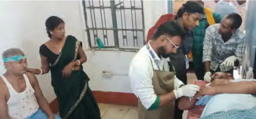
निज संवाददाता। बांका