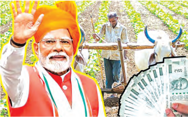
लग रहा है बिहार की हवा मुझसे पहले यहां पहुंच गई है : पीएम

पटना (नि.सं.) । शिक्षा विभाग ने बुधवार को 2400 शिक्षकों का अंतरजिला स्थानांतरण किया। ये सैते शिक्षक हैं, जिन्हें पहले मंगे गए तीन जिला का विकल्प में कोई भी जिला नहीं मिल सका था। इन शिक्षकों से दोबारा अन्य तीन जिलों का विकल्प मांगा गया था। स्थानांतरण ई-शिक्षा कोष पोर्टल के माध्यम से किया है। बिहार विधानसभा चुनाव का आचार संहिता समाप्त होने के बाद शिक्षकों का स्थानांतरण किया गया है। इन शिक्षकों से ई-शिक्षा कोष पोर्टल के माध्यम 23 से 28 सितंबर तक आवेदन मांगा गया था। इसके पहले राज्य के 41 हजार 689 शिक्षकों ने ऐच्छिक स्थानांतरण के लिए 5 से 13 सितंबर तक तीन-तीन जिलों के विकल्प के साथ आवेदन किया था। इसमें 24 हजार 600 शिक्षकों को उनके विकल्प वाले जिलों में स्थानांतरण किया गया था। शेष 17 हजार शिक्षकों द्वारा दिए गए विकल्प के जिलों में रिक्त की उपलब्धता नहीं होने के कारण स्थानांतरण नहीं हो सका था। इसमें से ही जिन शिक्षकों ने फिर से तीन-तीन जिला का विकल्प 23 से 28 सितंबर तक ई-शिक्षाकोष पोर्टल पर आवेदन किया था, उनका ही स्थानांतरण किया गया है।