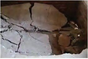
निज संवाददाता। बेगूसराय

बेगूसराय में आज एक स्कूल का फर्श धंसने से 6-7 बच्चे चोटिल हो गए। जिनका इलाज सरकारी अस्पतालों में कराया गया है। घटना साहेबपुर कमाल प्रखंड मुख्यालय स्थित रेलवे मध्य विद्यालय की है। घटना को लेकर जिला शिक्षा पदाधिकारी (DEO) ने जांच के आदेश दिए हैं। घटना के संबंध में बताया जा रहा है कि आज रेलवे मध्य विद्यालय साहेबपुर कमाल में प्रार्थना के बाद सभी बच्चे अपने-अपने क्लासरूम में गए थे। इसी दौरान सप्तम वर्ग में क्लास रूम का कोना अचानक चंस गया। बच्चे और शिक्षक जब तक कुछ समझ पाते, 6-7 बच्चे कोथेबे ढाई से 3 फीट के गड्ढे में नीचे गिर गए।