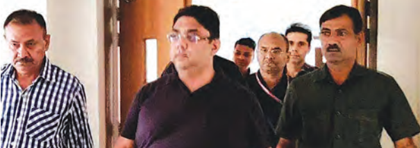
निज संवाददाता | पटना

300 करोड़ के बड़े फर्जीवाड़े में कार्रवाई