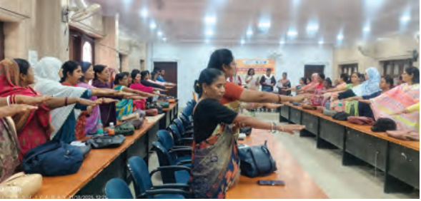
निज संवाददाता। अररिया

भागलपुर शहर के ठीक पीछे बसे शंकरपुर दियारा समेत 7 गांव के लोग मूलभूत सुविधा के लिए तरस रहे हैं। करीब 20 हजार आबादी वाले इस इलाके में गंगा नदी पर कर शहर पहुंचना चुनौती जैसी है। भागलपुर यूनिवर्सिटी के समानांतर बहने वाली गंगा इस क्षेत्र को पूरी तरह कटाव और बाढ़ की मार के बीच अलग-थलग कर देती है। इन गांवों के लिए आवाजाही का एकमात्र सहारा नाव है, जो रोजाना हजारों लोगों को शहर तक