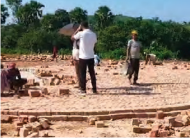
निज संवाददाता। भागलपुर

को हवाई पट्टी के लिए ग्रुप ने किया चिह्नित: जानकारी के अनुसार, अडाणी पावर लिमिटेड ने हवाई पट्टी के लिए जिस जमीन की पहचान की है, वह कहलगांव और पीरपैती के बीच स्थित है। हालांकि प्रशासनिक स्तर पर अभी इसके सर्वे और रिपोर्ट तैयार होने में समय लगेगा, लेकिन कंपनी ने राज्य सरकार से भी औपचारिक अनुमति प्रक्रिया शुरू कर दी है। बता दें कि अडाणी ग्रुप इस क्षेत्र में बड़े पैमाने पर औद्योगिक निवेश कर रहा है, जिसके चलते तेज आवाजाही और उच्चस्तरीय तकनीकी टीमों की लगातार आवक-जावक को देखते हुए एक समर्पित एयर स्ट्रिप की जरूरत महसूस की गई।